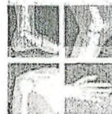
Боль в суставах